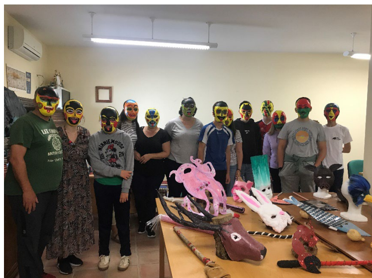
Figuras 3 y 4. Actos de celebración del 20 aniversario de la Casa Museo del Arcipreste