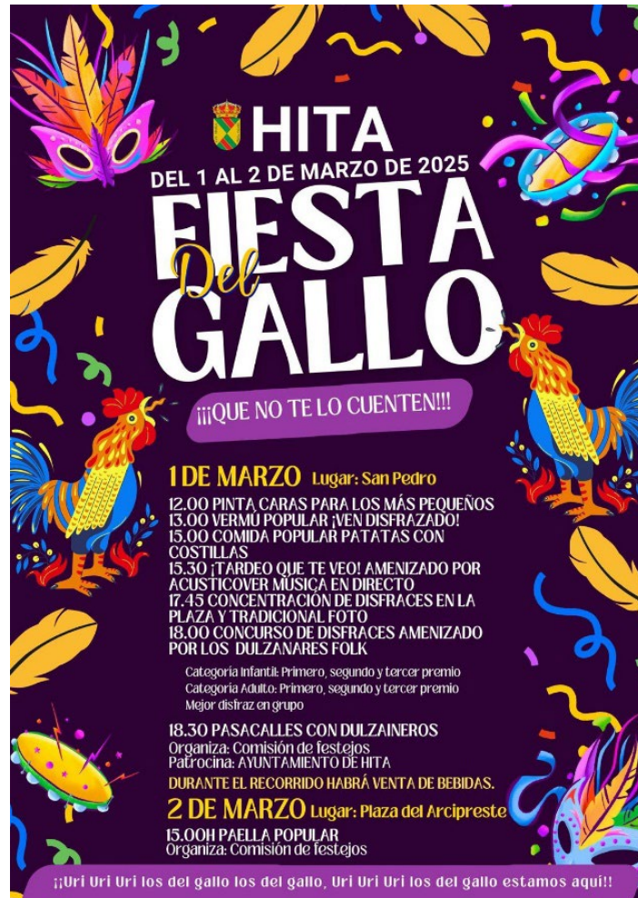
Figura 2. Cartel Fiesta del Gallo 2025

degustó una paella popular en la plaza del Arcipreste. La Comisión de Festejos organizó los actos con la colaboración de la Asociación Cultural Villa de Hita y el patrocinio del Ayuntamiento de Hita.