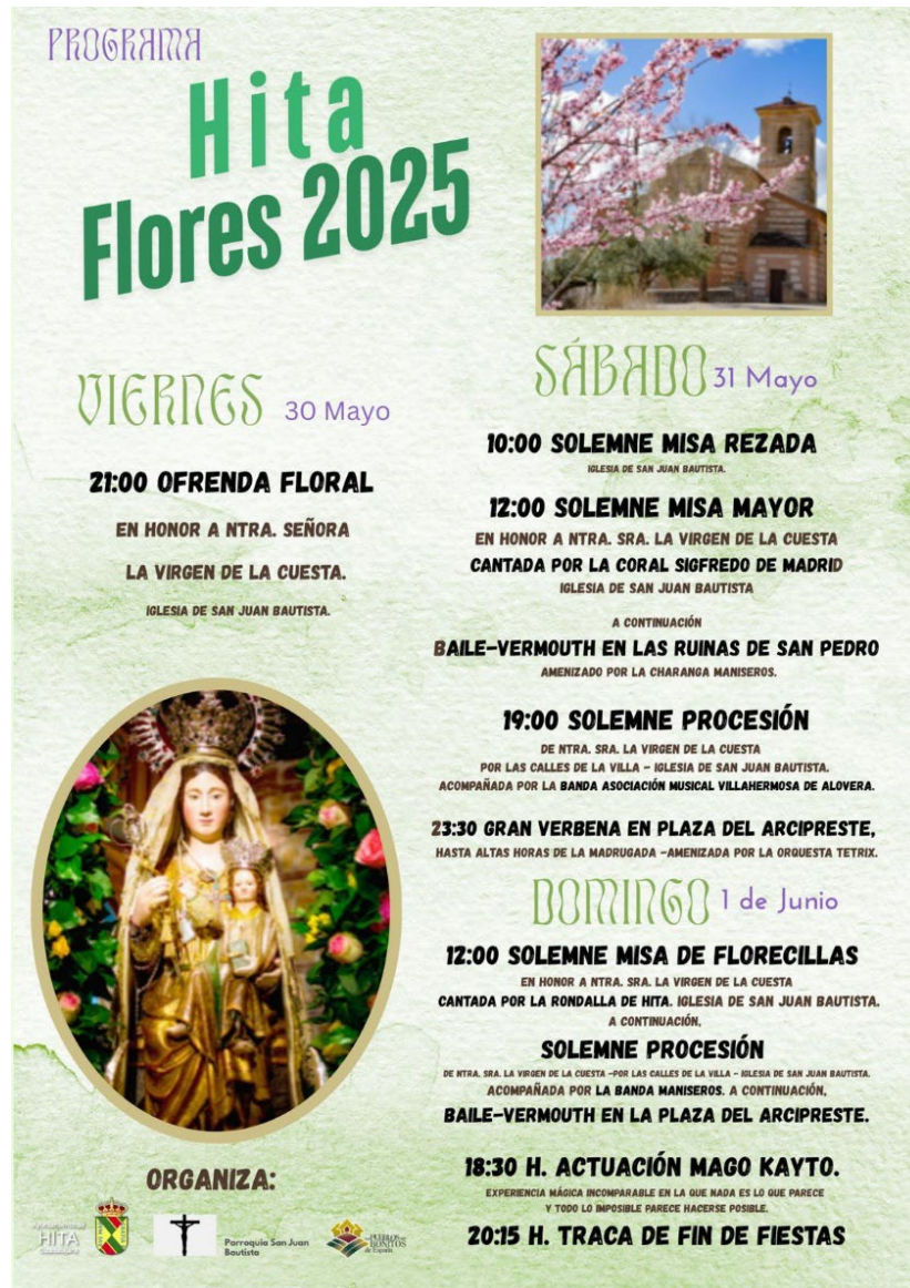
Figura 6. Cartel Fiesta de la Flores de Hita 2025