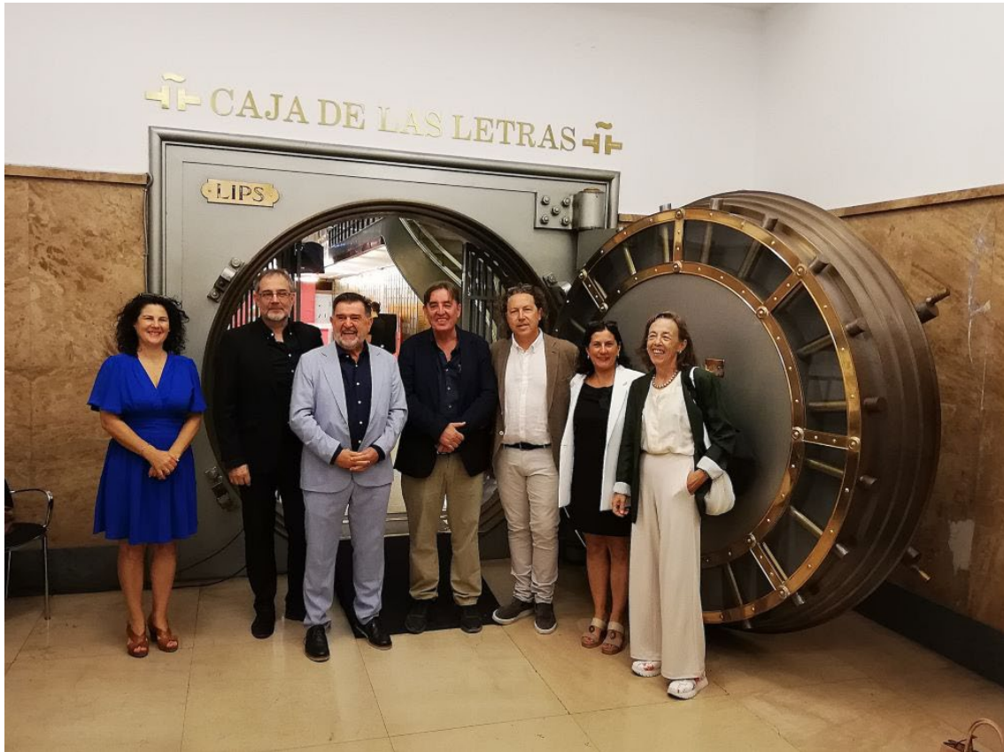
Figura 10. El Arcipreste de Hita en la Caja de las Letras, del Instituto Cervantes.

Teatro Medieval de Hita donde aparece el texto de la obra Doña Endrina , versión escénica del Buen Amor. El edil también depositó un pequeño cofre con tierra del solar que ocupó la Iglesia arciprestal de Santa María.