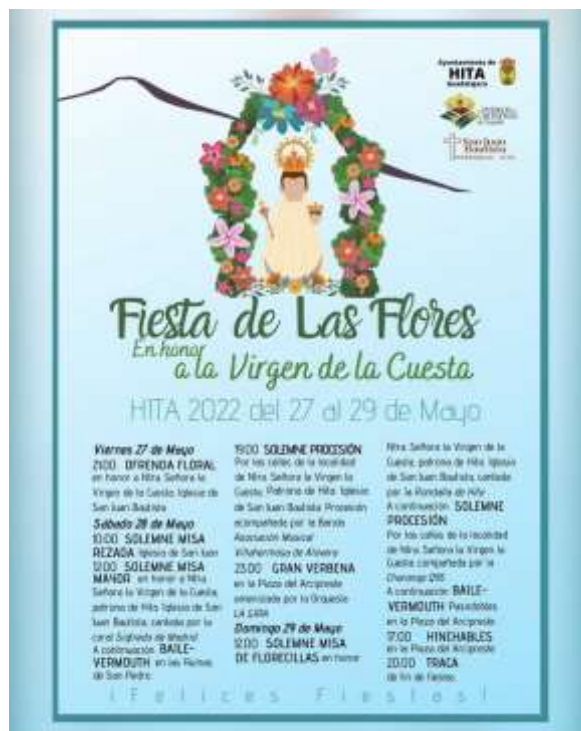
Cartel para la Fiesta de las Flores