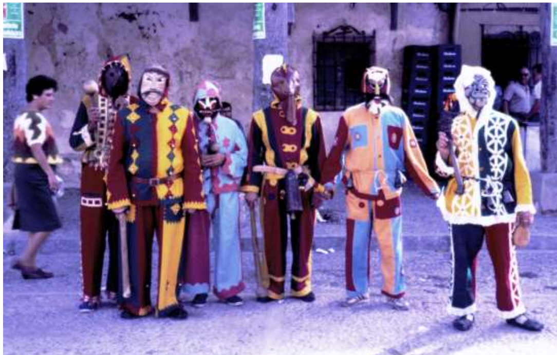
Botargas en el Festival Medieval de Hita. 1987. (Alonso, 2020, p.60) 3

Montarrón... El Festival Medieval de Hita ha servido de escaparate para que cada año miles de personas, durante más de medio siglo, conocieran a las Botargas de Guadalajara.