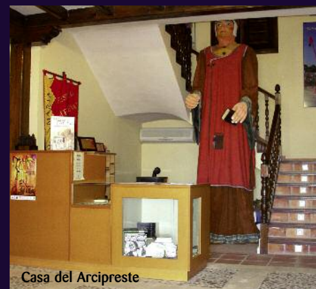
Casa del Arcipreste

man este barrio. Los "bodegos" excavados a pico en la ladera del cerro están formados por distintas estancias: la cocina con el hogar, las alcobas-dormitorio, el granero y la cuadra al fondo de la cueva. Actualmente estas construcciones se encuentran deshabitadas.