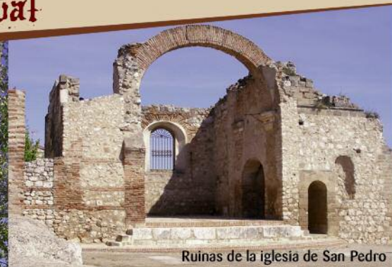
Ruinas de la iglesia de San Pedro

Hita conserva su casco antiguo de traza medieval y declarado Conjunto Histórico en 1965. Bajo dominio musulmán se estableció una fortaleza en la cima del cerro en cuya ladera se asienta la villa. A lo largo del siglo XIII se forma una importante judería y un siglo después Juan Ruiz, Arcipreste de Hita , escribe el Libro de Buen Amor. En el siglo XV se vive un último período de esplendor siendo señor de la villa el Marqués de Santillana. En el siglo XX se produce la destrucción de gran parte del casco antiguo a consecuencia de los bombardeos de la Guerra Civil.