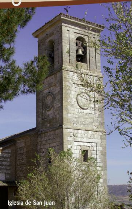
Iglesia de San Juan