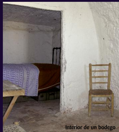
Interior de un bodega

A media ladera aparece el solar que ocupó la Iglesia Arciprestal de Santa María. A esta altura se localiza el Barrio de los Bodegos . Se denominan así a las casas-cueva de origen medieval que for-