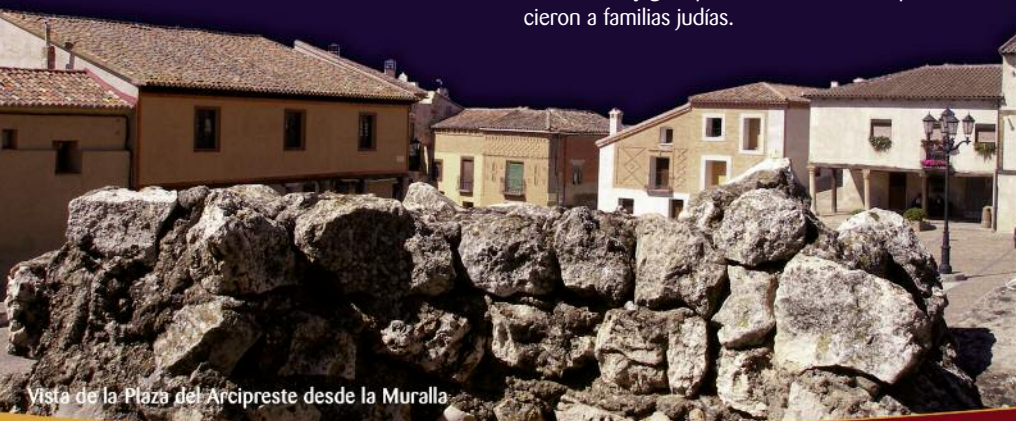
Vista de la Plaza del Arcipreste desde la Muralla

La Casa del Arcipreste alberga un pequeño museo dedicado al Libro de Buen Amor y otras colecciones de interés. La Iglesia de San Pedro fue destruida en la Guerra Civil. Se conservan parte de sus muros y algunas lapidas sepulcrales de los hidalgos. La Iglesia de San Juan es de estilo gótico-mudéjar salvo la torre herreriana. En su interior destacan varios artesanados.