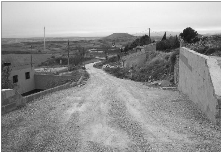
↑ Calle Puerta de La Laguna que va a ser asfaltada

Está previsto el acondicionamiento de esta vía hasta la carretera de Espinosa. La obra consiste en el acondicionamiento de esta calle con asfalto. Esta obra permite que el acceso de vehículos pueda realizarse en mejores condiciones. Las obras se iban a realizar en el mes de noviembre, pero las malas condiciones meteorológicas han hecho que las obras se aplacen hasta el mes de febrero. No obstante se ha extendido una capa de zahorra que mejora los accesos para estos meses.