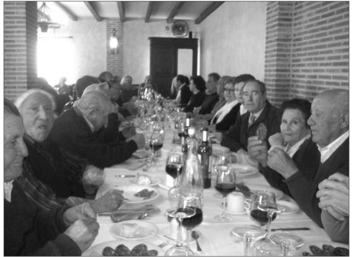
↑ Comida de hermandad de la Asociación de Jubilados D o Endrina, celebrada el pasado 4 de diciembre.