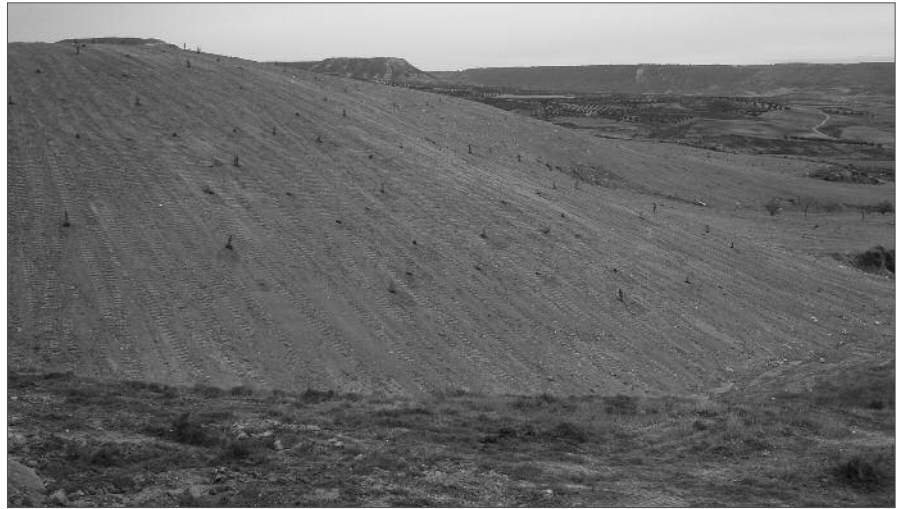
La escombrera de Hita ha quedado sellada y acondicionada. También se han realizado trabajos de hidro-siembra en la zona.

Para tener toda la información sobre el nuevo sistema de gestión de escombros consulte en el Ayuntamiento. Y recuerde: ninguna obra puede comenzar sin la correspondiente resolución de licencia de obra (no es suficiente con haber realizado solamente la solicitud de licencia). Por tanto, solicite la licencia de obras con antelación suficiente.