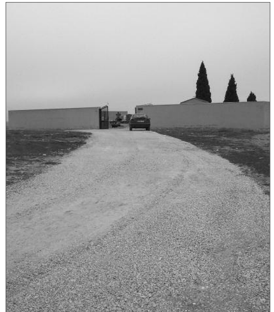
↑ Capa de zahorra en el acceso al cementerio

Recientemente se ha acondicionado el acceso al cementerio con una capa de zahorra. Esta era una zona que quedaba en muy malas condiciones cuando se producían lluvias