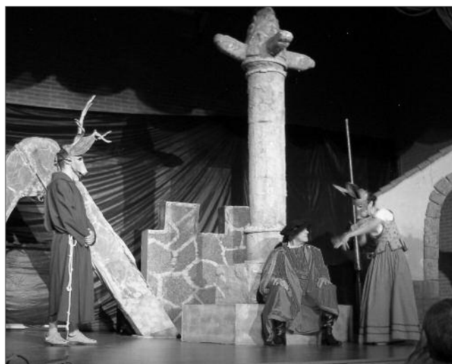
Momento de la representación teatral: Combate de D. Carnal y D o Cuaresma.

El premiado tuvo unas palabras de agradecimiento para todos. Recordó los orígenes alcarreños de su familia y a