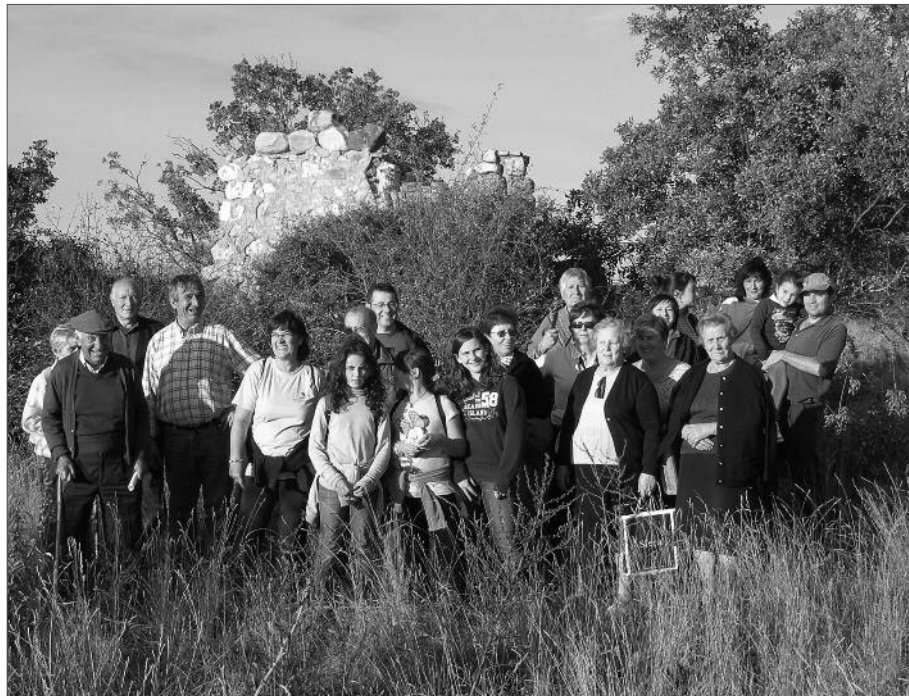
Vecinos de Hita durante la ruta al Monte de las Tajadas del programa “Conoce tu pueblo”. En abril se desarrollarán más rutas.

• Han finalizado las rutas de senderismo organizadas por el Ayuntamiento. El programa se ha denominado “Conoce tu pueblo” y se ha desarrollado durante el mes de octubre. En el mes de abril del año que viene el programa “Conoce tu pueblo” volverá a organizarse.