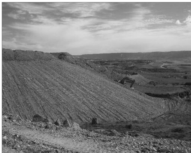
Trabajos de sellado y acondicionamiento de la escombrera de Hita

De acuerdo con la normativa en vigor para la gestión de residuos de construcción y demolición , y tras la comunicación de la Delegación de Agricultura y Medio Ambiente (de fecha 9 de julio y 11 de agosto de 2010) instándonos al cese de actividad, el vertedero de escombros de Hita se ha cerrado.